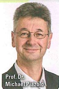
Prof. Dr. Michael Piazzolo